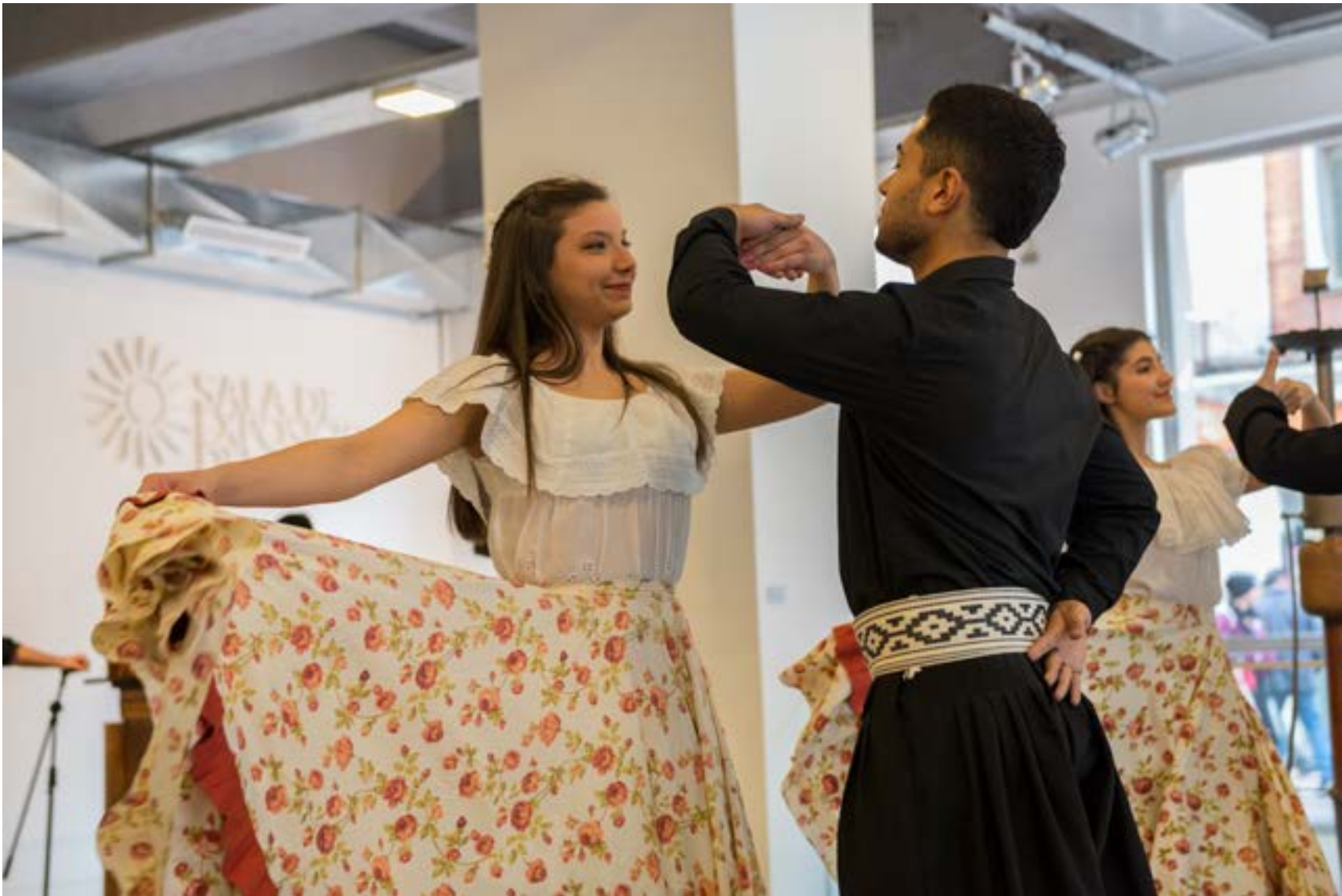
Escuela Nacional de Danza: Área Folclore