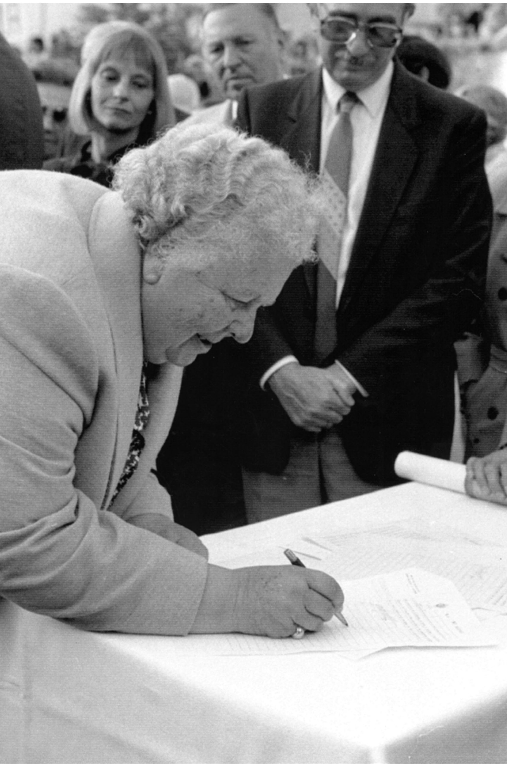
Adela Reta , presidenta del Consejo Directivo del Sodre entre 1995 y 2000.