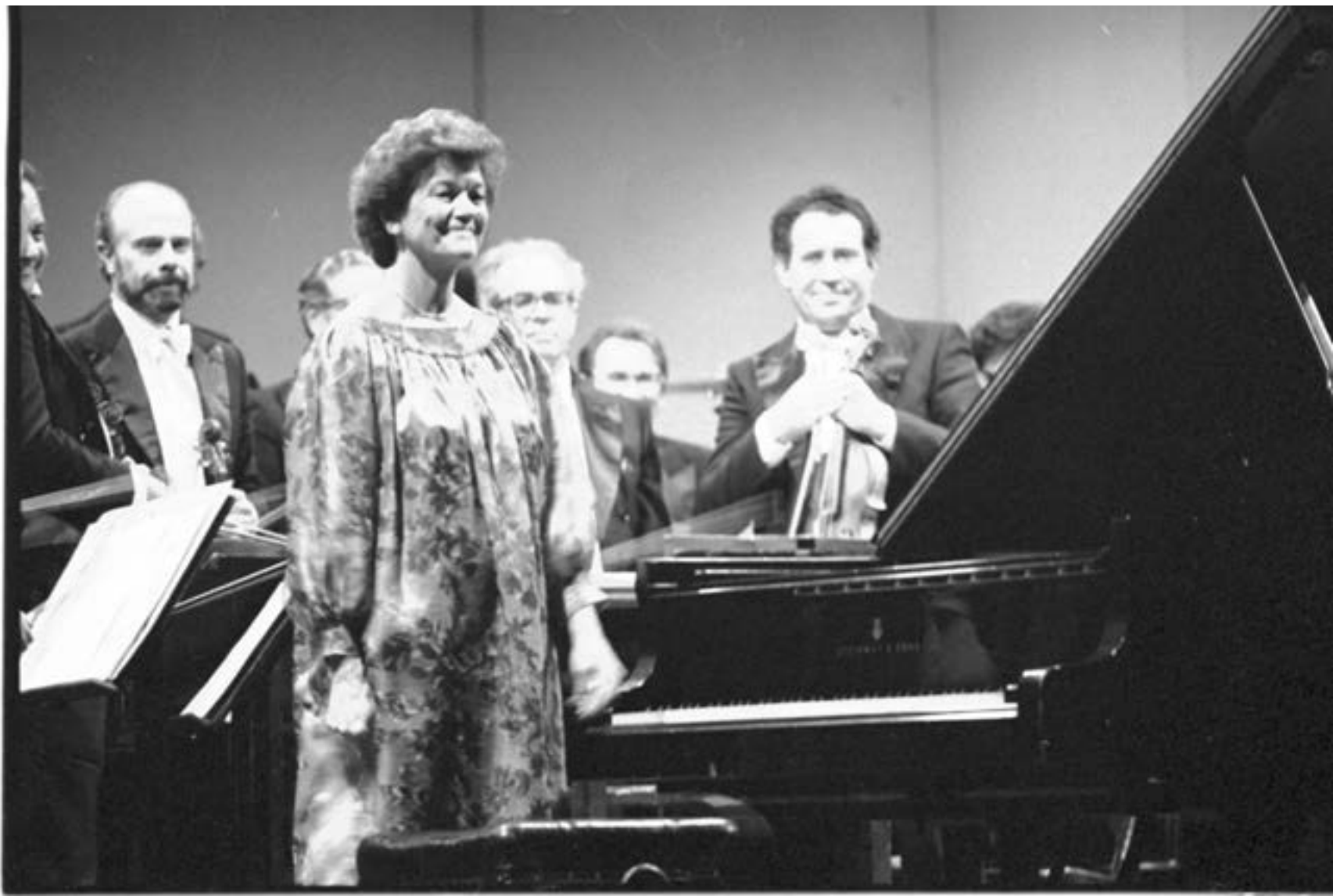
Victoria Schenini , pianista. Concierto de la Ossodre en el Teatro Solís, 28 mayo de 1983.