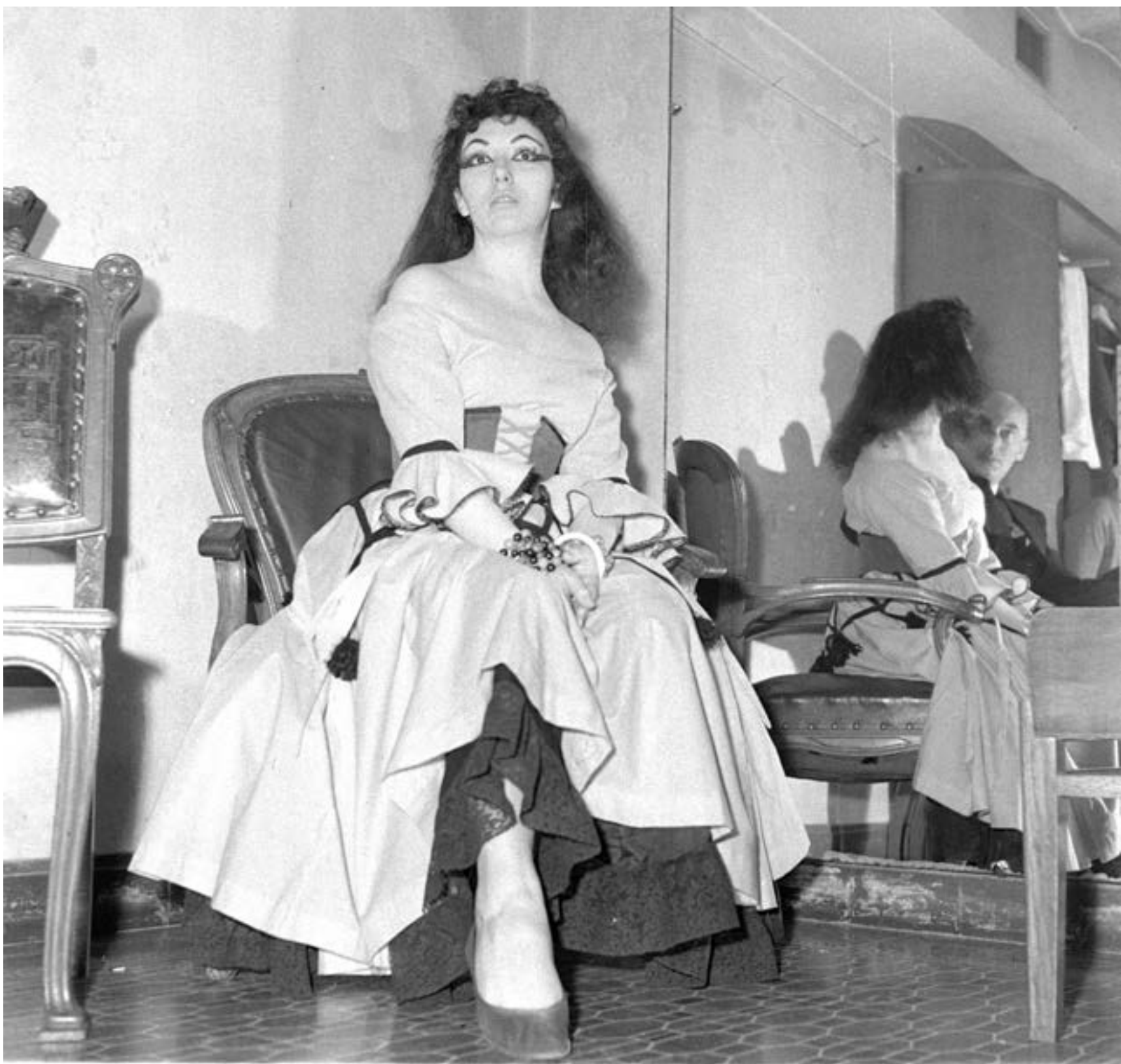
Nelly Pacheco , mezzosoprano, en la ópera Rigoletto . 30 de setiembre de 1962.

Nelly Pacheco es una cantante emblemática en el panorama lírico nacional. Además de su bella voz, es una artista en el sentido global de la palabra. Sus dotes de actriz y marcado temperamento le valieron los más destacados elogios en los momentos cumbre de su carrera, desarrollada