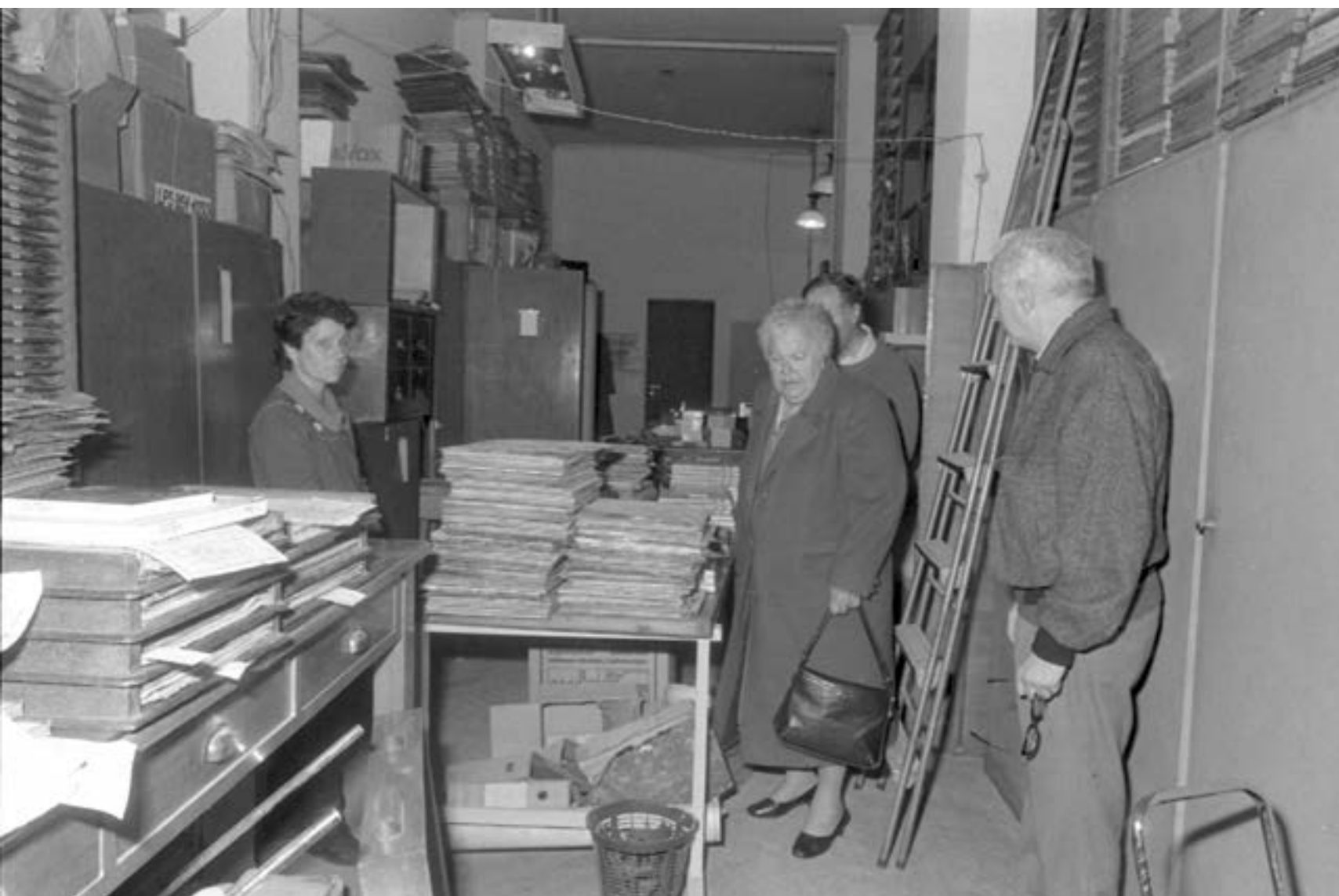
Visita de la ministra de Educación y Cultura, Adela Reta, a los estudios de la Radio del Sodre en la calle Sarandí. Julio de 1989.