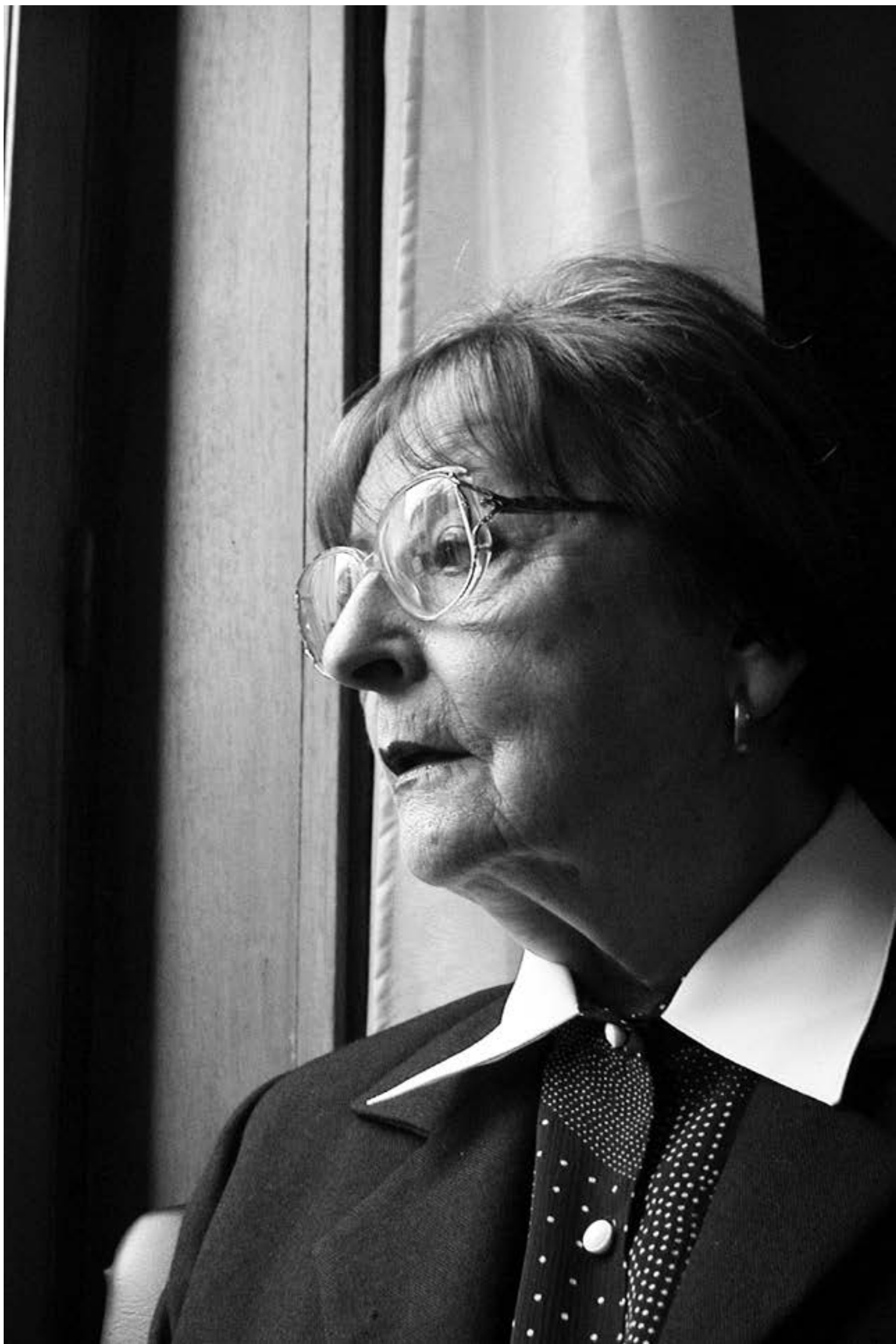
Nelly Goitiño , presidenta del Consejo Directivo del Sodre entre 2005 y 2007.