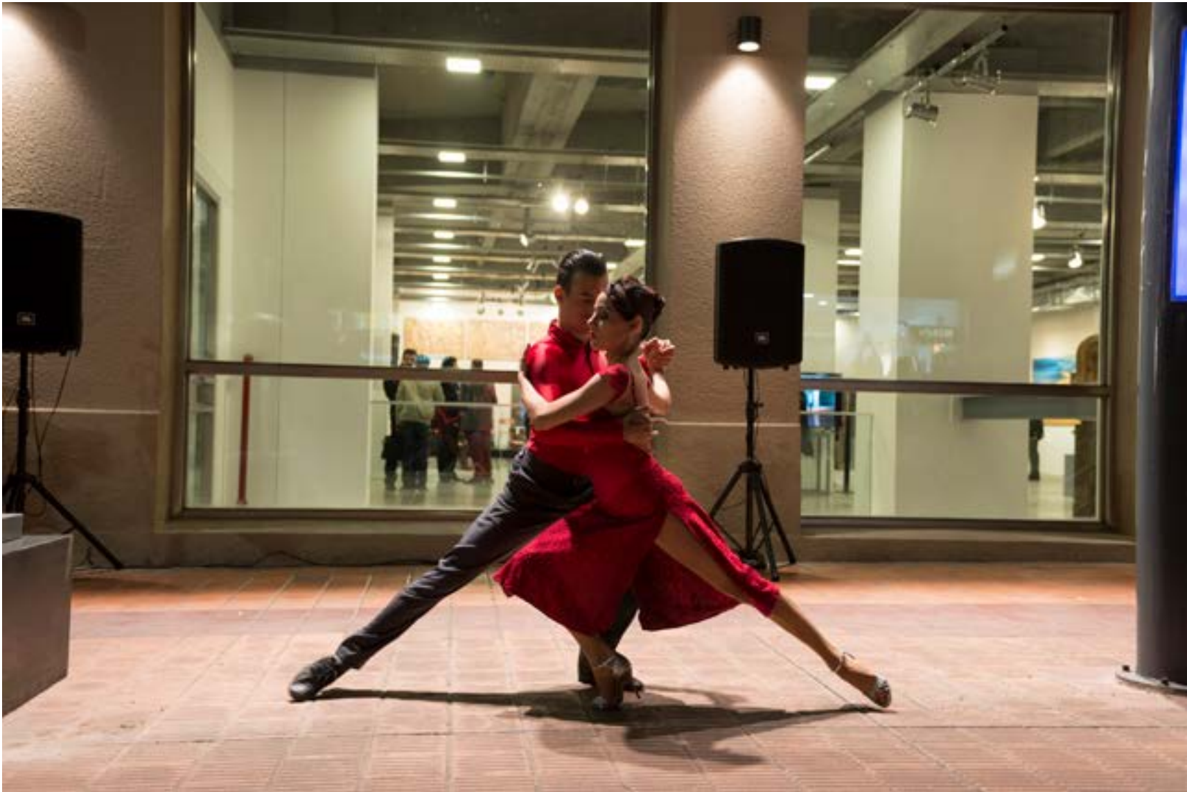
Escuela Nacional de Danza: Área Tango