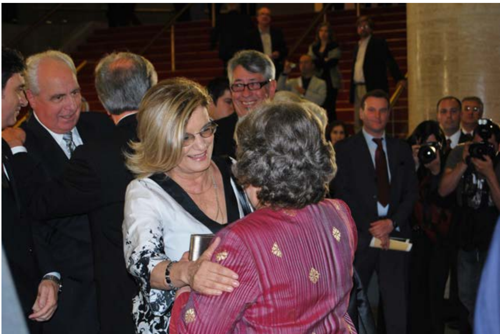
Eneida de León , presidenta del Consejo Directivo del Sodre entre 2013 y 2015.